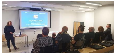
Atelier dédié à l'accueil des étrangers

Profitez de temps d'échanges, d'ateliers, d'informations spécifiques et d'avantages toute l'année en rejoignant notre communauté touristique.