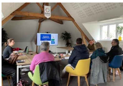
Atelier Classement de meublé de tourisme