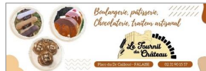
Exemple de publicités