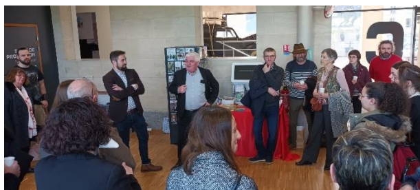
Journée rencontre des partenaires de l'Office de Tourisme Mars 2024 – Mémorial de Falaise