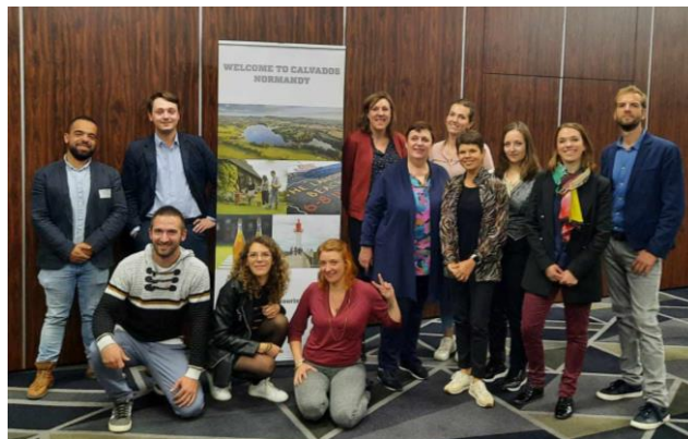
Roadshow en Angleterre – Octobre 2023