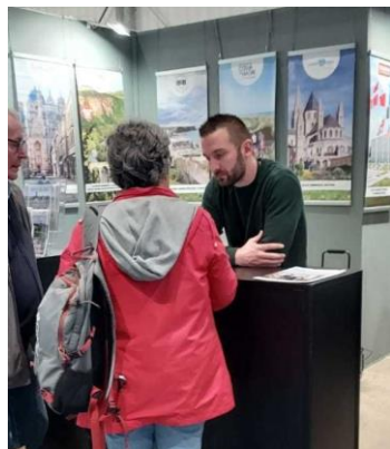
Salon du Tourisme à Lille Janvier 2024

Valorisation de l'offre touristique, présence sur les salons spécialisés à destination du grand public ou des professionnels, conception de produits touristiques, démarchages, accueil de groupes, actions extérieures, création et mise à jour d'outils de communication, relations presse.